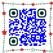
ประถมศึกษา